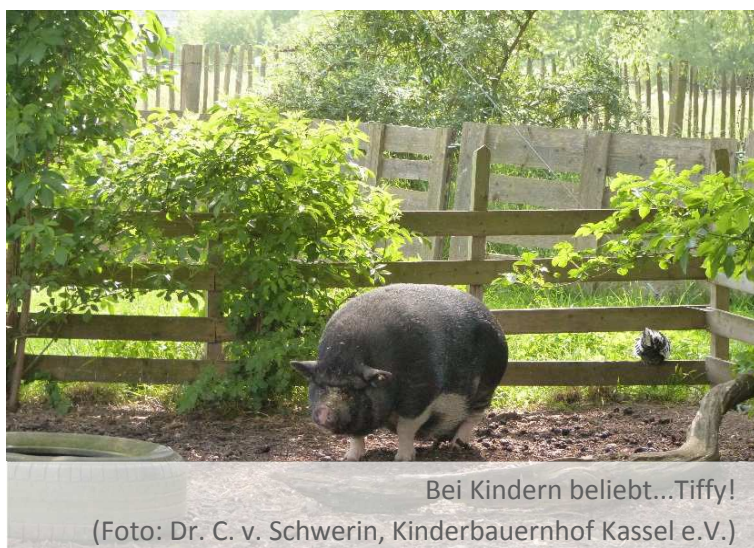
Bei Kindern beliebt...Tiffy!