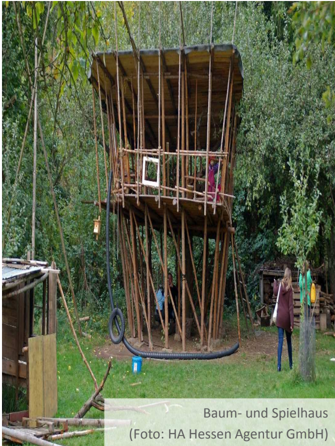
Baum- und Spielhaus