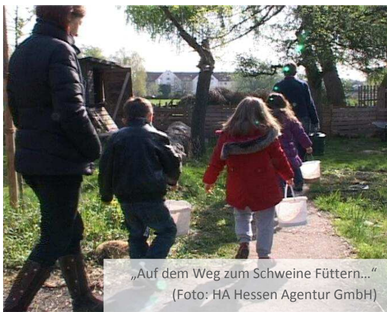
„Auf dem Weg zum Schweine Füttern...“

Inzwischen sind auch Angebote bei schlechtem Wetter und im Winter möglich. Denn der Kinderbauernhof ist seit 2010 Förderprojekt der Stiftung STAR CARE . Durch zahlreiche Spenden konnten ein festes Gebäude, ein Strohhallenhaus und eine Scheune auf dem Kinderbauernhof entstehen. (Quelle und weitere Informationen unter: www.kinderbauernhof-kassel.de )