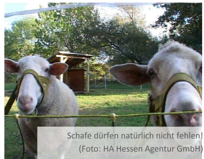
Schafe dürfen natürlich nicht fehlen!

Der Kinder- und Jugendbauernhof hatte in den Jahren 2007 – 2016 ein Gesamtvolumen von einer Million Euro. Hierin sind alle Förderungen und Spenden von 170.000 Euro enthalten. Ohne eine Förderung durch die Soziale Stadt wäre das Gesamtprojekt „Kinderbauernhof Kassel“ nicht möglich gewesen, es gäbe kein Kinderbauernhof in Kassel.